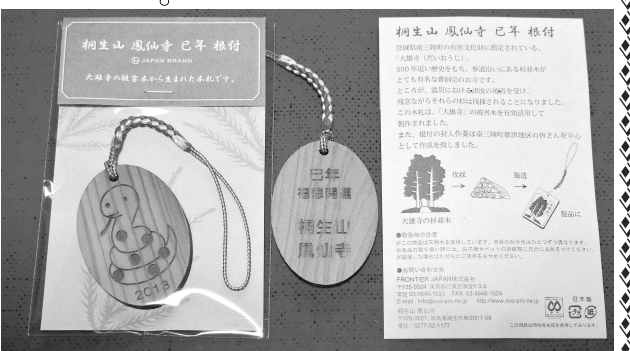
桐生山 鳳仙寺 巳年根付け

第14回写経の会開催のご案内です。鳳仙寺では年2回行っている恒例の行事です。開催日である2月15日は、涅槃会(ねはんえ)です。涅槃会とはお釈迦様が亡くなりになった日です。当日は、涅槃会の法要を行った後に、写経を行う予定です。皆さまのご参加をお待ちしております。 ■日時 平成25年2月15日(金) 13時より ■人数 30名くらい ※鳳仙寺婦人会の皆さんも一緒に参加します。